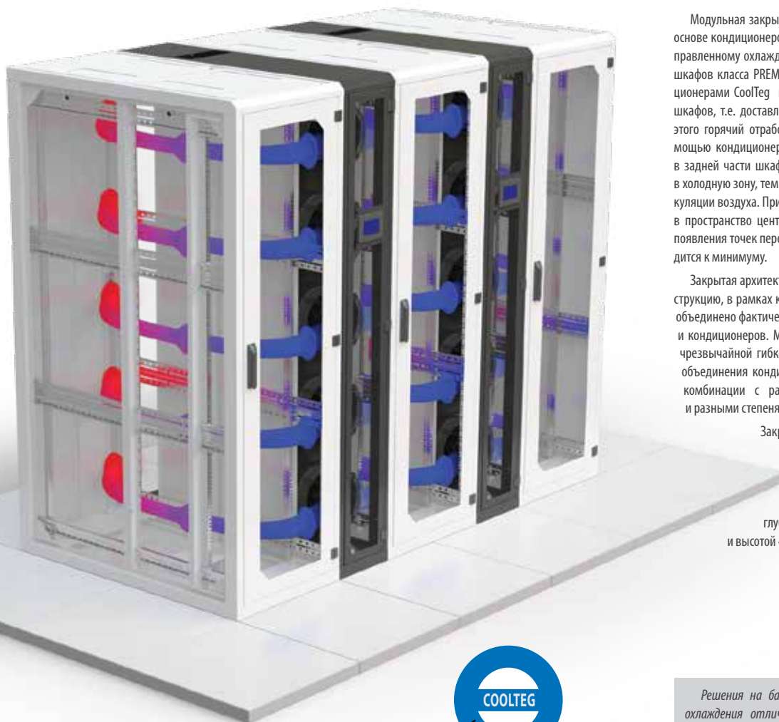
Изображение приведено исключительно для иллюстрации

Применение решения на базе модульной закрытой архитектуры охлаждения позволяет отводить с каждого шкафа до 35 кВт тепла. Такая архитектура может быть особенно целесообразна, если планируется установка нескольких шкафов с очень высокой тепловой нагрузкой и необходимо избежать выброса горячего выхлопа из шкафов в помещении ЦОД. Это решение также идеально подойдет, если в ограниченном пространстве (например, в небольшой серверной комнате компании среднего размера), необходимо разместить и охладить оборудование высокой плотности монтажа.